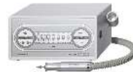
Model TEC A 500

Brusni aparat TEC A 500 ili TEC A 250-garancija 2 god.