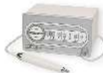
Model TEC A 250